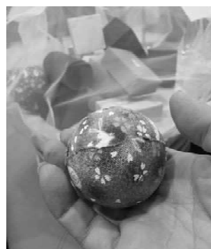
図 3 パーツの大きさ