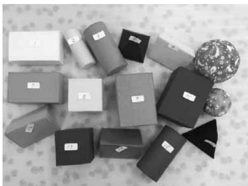
図 2 SOSE の各パーツ

SOSE を表現するためのパーツを、厚紙を用いて複数の形状で作成し、複数の色彩のフェルトで包んで仕上げた（図 2、図 3）。褒められたり認められたり評価されたりした際に高まる思いが、一つ一つのパーツによって表現されている。