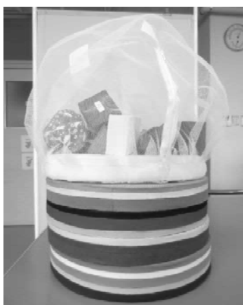
図 4 SOBA-SET の全容 (1)