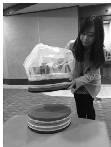
図 5 SOBA-SET の全容 (2)